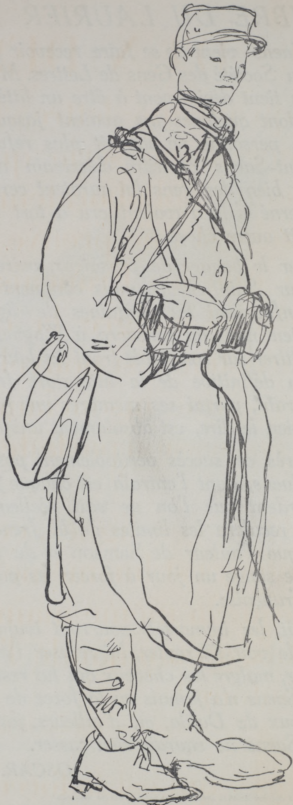
DESSIN DE A.-D. DE SEGONZAC, SERGENT AU N° D'INFANTERIE